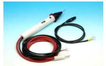
HV-5 / HV-6 先端形状 赤:プローブ 黒:ワニ口クリップ