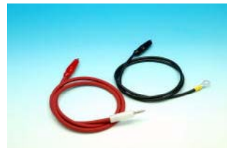
HS-10 / HL-10 / HTV-10 先端形状 赤/黒:ワニ口クリップ