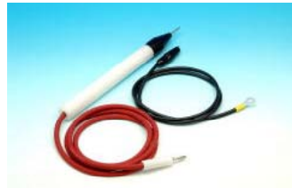
HV-2シリーズ 先端形状 赤:プローブ 黒:ワニ口クリップ