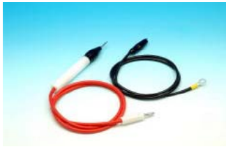
HV-1シリーズ 先端形状 赤:プローブ 黒:ワニ口クリップ

※ 測定用テストプローブ及びテストリードは、必ず電気用絶縁ゴム手袋を装着した上でご使用ください。